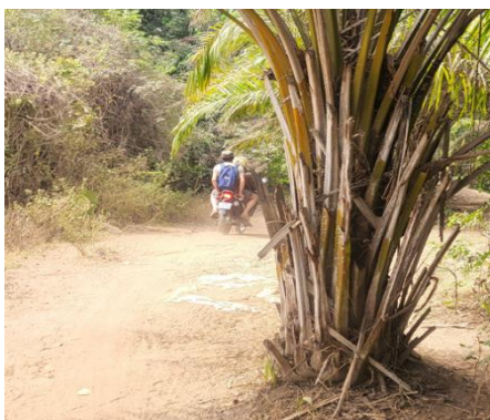
Figure 2 : Bernard à moto sur de petites pistes, seuls accès à ces villages très isolés.

Nous avons aussi visité à moto les dix villages isolés du canton d’Ountivou concernés par le futur projet eau et quelques autres afin de traiter des problèmes d’usage de l’eau et de maintenance.