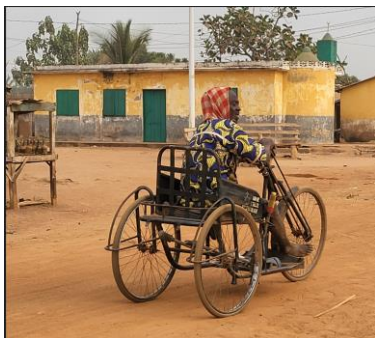
Figure 5 : Handicapé en fauteuil roulant dans les rues d'Ountivou

Vous stockez une béquille ou une canne de marche dans un placard ou à la cave ?